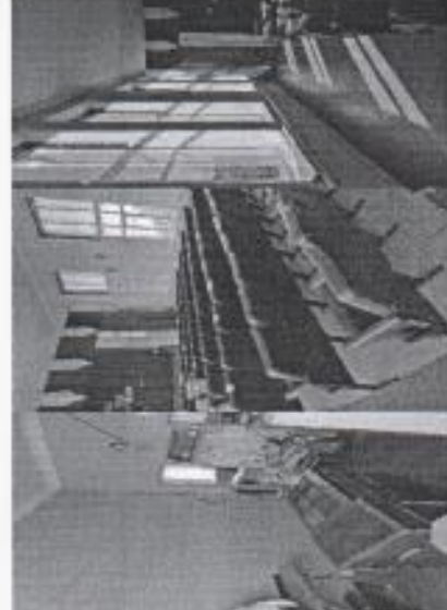
Фото спортивного зала