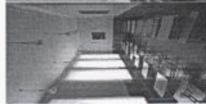
Фото актового зала