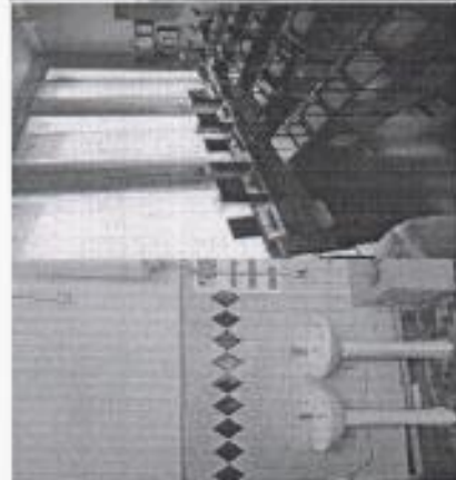
Фото кабинета информатики